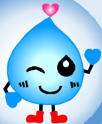
水の妖精 スイットくん