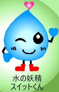
水の妖精 スイットくん