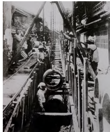
下水道工事の様子

★セメントは土木工事には欠かせない 材料の一つで、モノとモノをくっつけ る役割があります