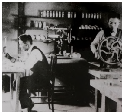
セメント試験を行う当時の市職員

★セメントは土木工事には欠かせない 材料の一つで、モノとモノをくっつけ る役割があります