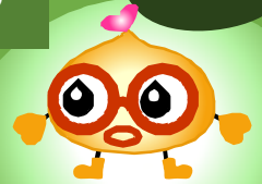
スィーパーくん(あだ名は「博士」)

エスディーゼーションズへん このSDGs編では、みんなの地球を守るため すいどう げ すいどう エスディーゼーションズ かんが 水道・下水道のSDGsを考えてみよう！