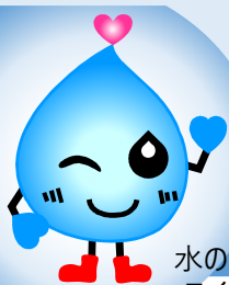
水のようせい スイットくん

やあ、みんな。ぼくの名前はスイットくん！ これから1年、みんなと一緒に水道や下水道、 かんきょうのことを勉強するよ！