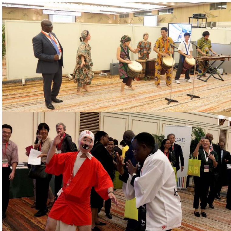
(TICAD閣僚会合における鹿児島県三島村（ジャンベ演奏）、 宮崎県日向市（ひよっこ踊り）のパフォーマンス 2018年10月)