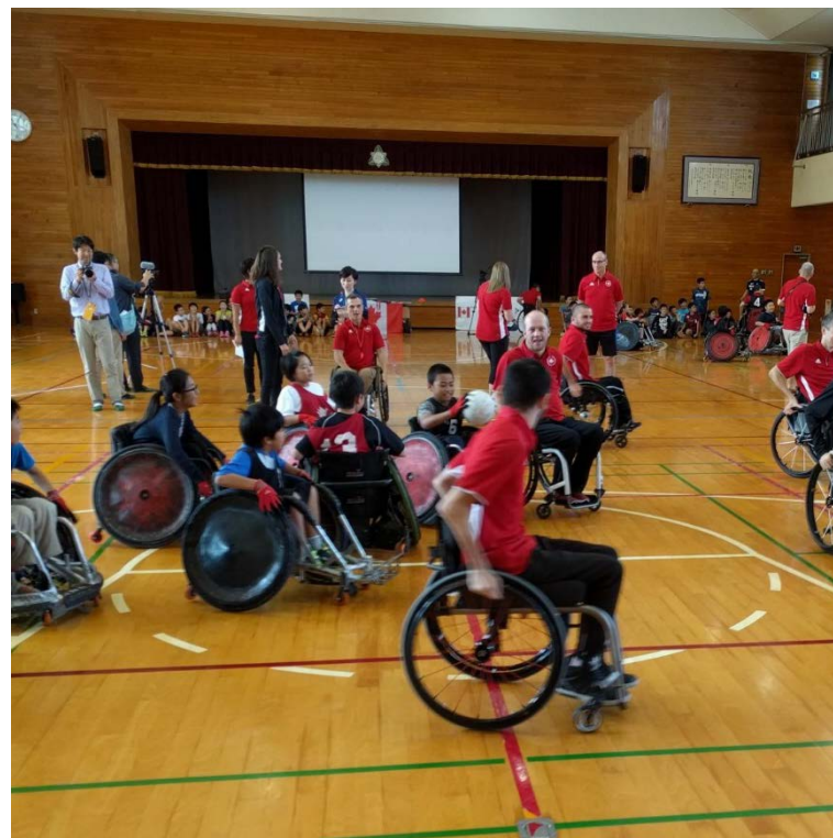
(青森県三沢市でカナダ車いすラグビーチームの受入れ 2018年10月)