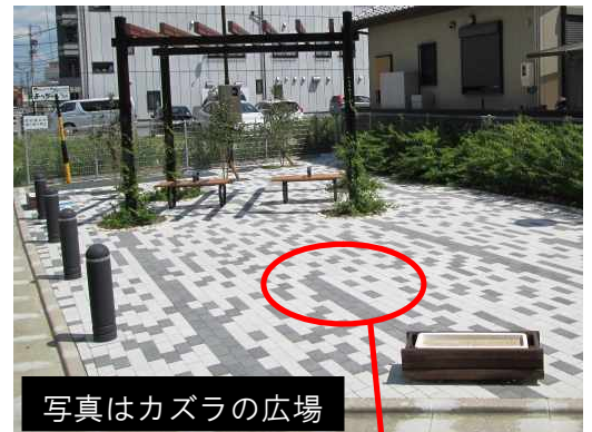
写真はカズラの広場