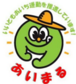
いいともあいち運動シンボルマーク 「あいまる」