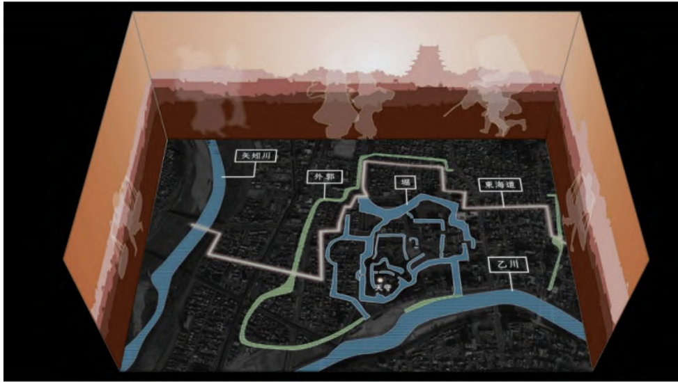
現代 MAP と城郭