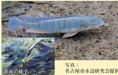
群泳の様子

食用として日本に導入されたが、名古屋市内の河川で毎年繁殖している。雑食性であり、在来生態系に悪影響を与えるおそれがある。