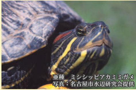
亜種 ミシシippアカミミガメ

亜種ミシシippアカミミガメが、ミドリガメとして流通している。在来のカメ等に悪影響を与えるおそれがある