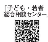
「子ども・若者総合相談センター」