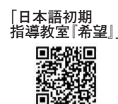
「日本語初期指導教室『希望』」

になかなか馴染めない日本語指導が必要な児童生徒が安心して日本の学校に通うことができるように、初期段階の日本語の習得や日本文化への適応を図ることを目指している。