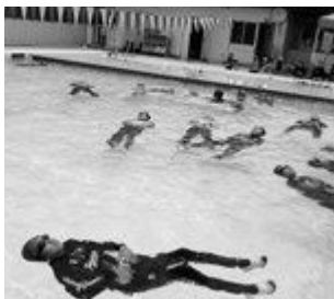
▲着衣泳講習会 (上地小)