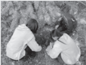
▲植物を調査する様子