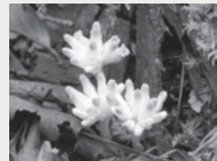
▲ヒナノシャクジョウ

(開花時期：夏) VU VU 県下に生育地の少ない貴重な植物。A 湿地から B 湿地で見ることができる。