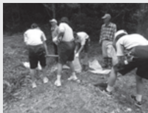
▲土のうを作る様子