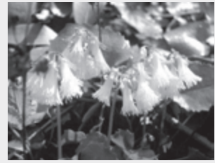
▲ナンカイワカガミ

(開花時期：春) NT A 湿地の山肌に群生地があり、白色の美しい花を咲かせる。