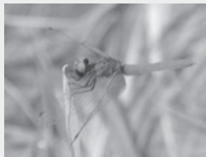
▲ハッチョウトンボ

(3月～4月) NT NT 里山の春の女神と呼ばれ、湿地の入口からやなが沢池周辺で多く見られる。