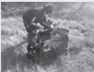
▲刈り取った草を運ぶ様子