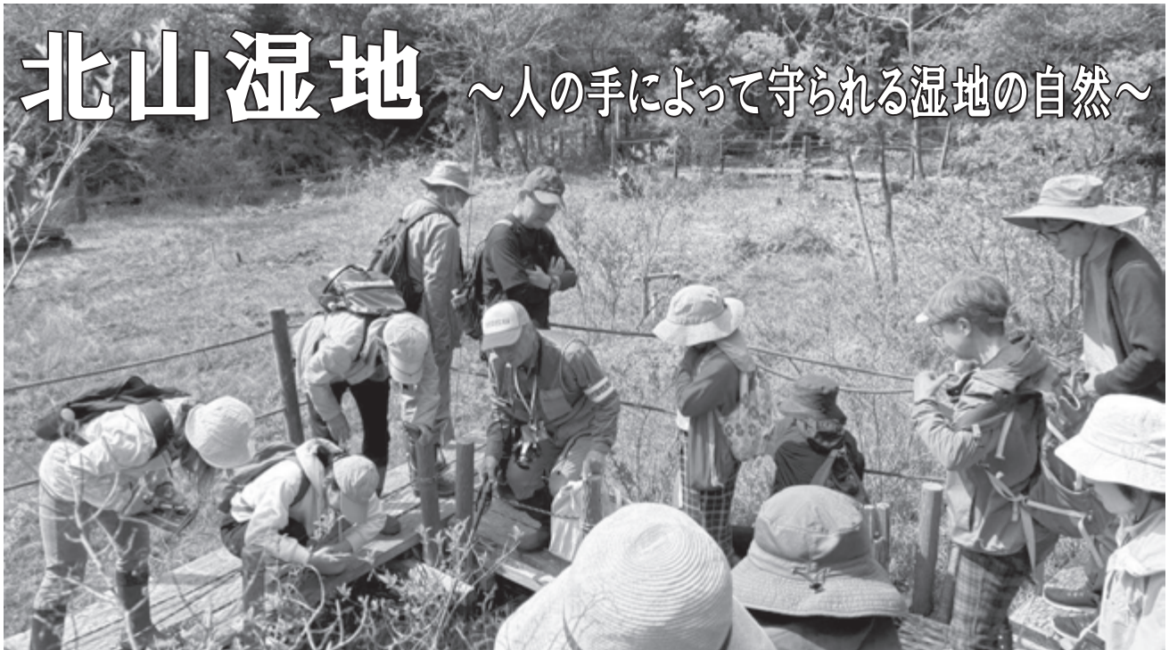
▲自然観察会の様子

北山 きたやま 湿地は、岡崎市池金町にある尾根の谷間に位置する。市内で最も古くから残るミズゴケ類を主体とした湿地群である。低く連なる山の起伏の間から複数の小さな水の流れが生じ、緩やかな傾斜をたどって流れる中で各所に水が停滞し、十一箇所（マップA～K）の湿地が形成された。 北山湿地には、トウカイコモウセンゴケやモウセンゴケなどの食虫植物が生育している。春にはハルリンドウの花を広い範囲で見ることが出来る。また、夏には湿地特有の昆虫の代表種であるハッチョウトンボが、数多く確認されている。 希少な動植物を守るため、さまざまな団体が協力して湿地の保全活動に取り組んでいる。二〇二三年には、岡崎市と「おかざき湿地保護の会」「岡崎市動植物調査会」の三者で構成する「おかざき湿地保全活用協議会」が設立され、除草や樹木の伐採、草刈り、木道や散策道の整備、看板・防護柵の設置などの保全作業を行っている。また、ヒナノシャクジョウ、ギフチョウなどの調査をしたり、湿地の動植物に親しむ自然観察会を実施したりしている。さらに、愛知県立岡崎高等学校のSSH（スーパーサイエンスハイスクール）部は、「おかざき湿地保護の会」と協力し、環境整備や希少な動植物の調査、湿地保全に関する研究活動を行っている。東海中学校の自然科学部も保全作業に参加し、草刈りや水害からギフチョウを守る活動に取り組んでいる。 北山湿地に生育する植物や生物の多くは、湿地という特別な環境でしか生きることができず、人の手による保全が必要である。湿地の生態系を守るために、これからも市民が協力し合い、豊かな岡崎の自然を未来へつないでいきたい。