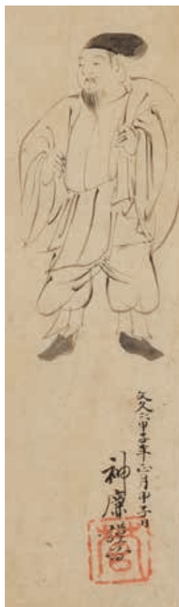
図8 冷泉為恭「大黒天・和歌・詞書」大黒天図 部分(岡崎市美術館)

その人とは冷泉為恭(一八二三〜六四)と、同い歳ながら為恭が師とも仰いだ天台僧願海(一八二三〜七三 宮崎も「やまと絵師・岡田為恭による交流の表現―「石雲清事」に注目して」『美術フォーラム21』第五十二号 二〇二五年)。為恭と云えば、まずは大樹寺の障壁画群を上げるのが普通だろうが、当館の所蔵品にも定評ある作品が少なくない。なかで『大黒天図』(図8)は近年の収蔵にかゝる逸品。頭巾を被り福袋は担ぐもの、打出の小槌は持たず、通常の大黒天とは像容を異にする。しかも着衣は、まさしく大國主命をも思わせるような古代人のそれ。それが、