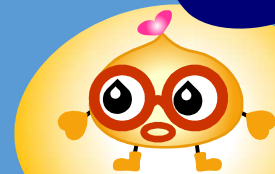
スイベークン(あだ名は「博士」)