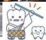
(日本歯科医師会キャラクター「よ坊さん」)