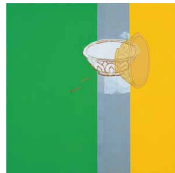
前期 後期 ©1996 Takashi Murakami/Kaikai Kiki Co., Ltd. All Rights Reserved.