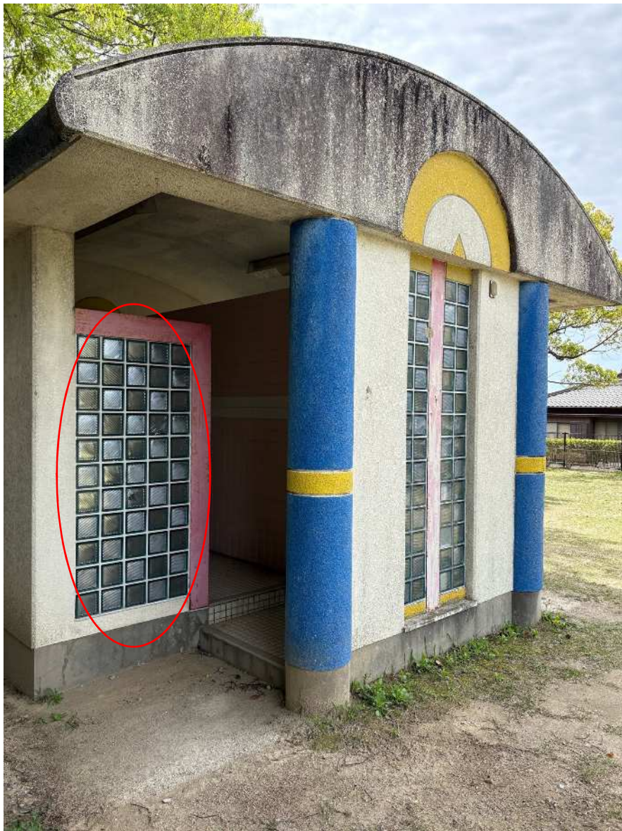
女子トイレ 被害状況①