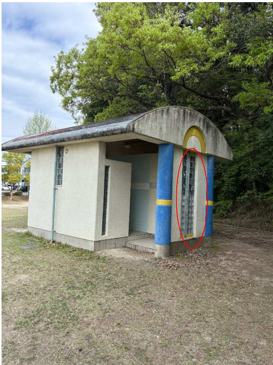
男子トイレ 被害状況①