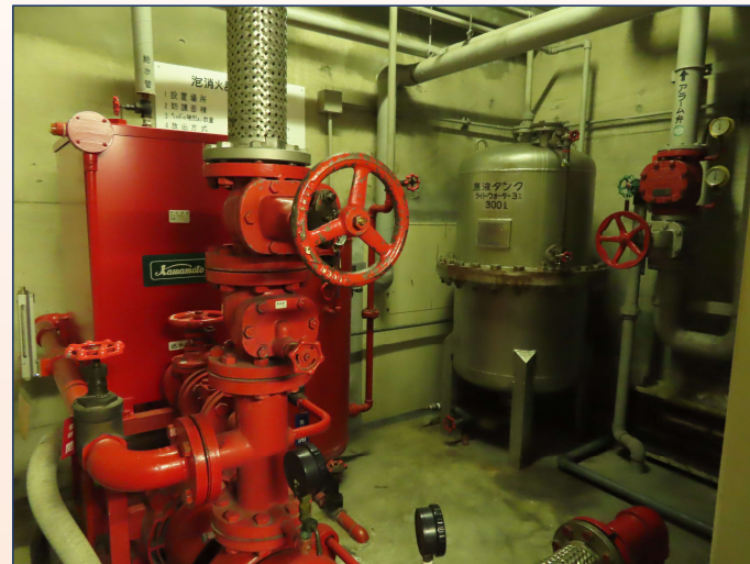
▲本館棟1階の泡消火設備（既存不適格）