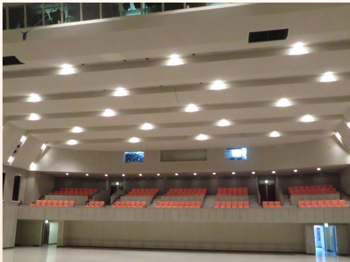
▲ホール棟大規模空間天井（既存不適格）