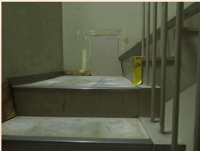
▲本館棟東階段の床面タイルの剥離