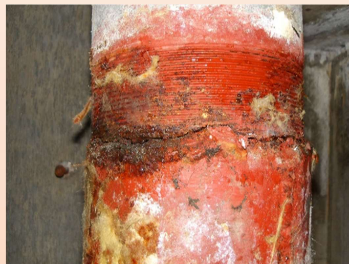
▲本館棟西階段壁面内部の排水管腐食