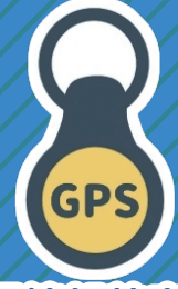
位置情報特定装置