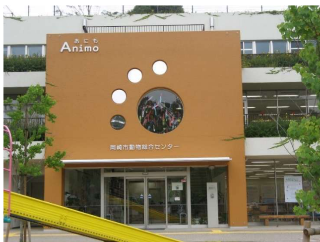
動物総合センター

第四に、行政内部の異なる部署間において互いに情報を共有し、時には調整を図りながら、総合的に施策を進めていく必要があります。動物総合センターは動物に関する専門知識を活かし、統制する役割が求められます。