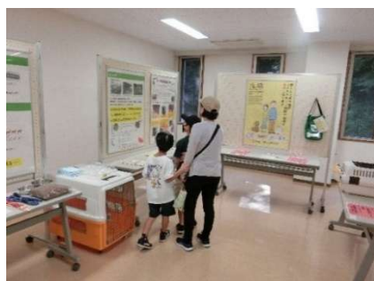
動物愛護週間イベント (ペット災害啓発展示)

また全国的に拡大している動物由来感染症の予防対策として、基本的な衛生管理の手洗いを始めとした動物との正しい接し方について、なかよし教室やイベント、ホームページ等により周知します。