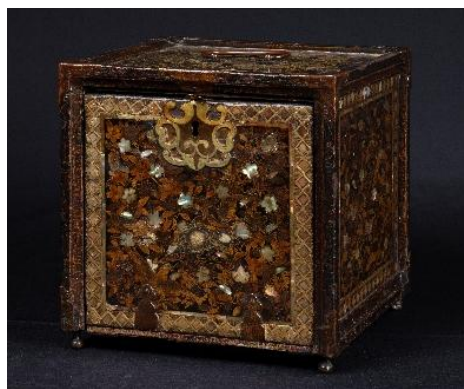
* 8 《花鳥蒔絵螺鈿書筆筒》