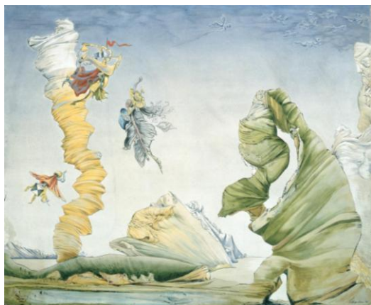
* 3 クルト・セリグマン《メムノンと蝶》