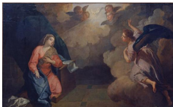
* 2 作者不詳《受胎告知》