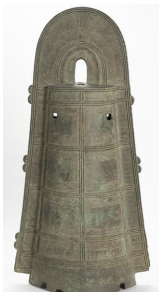
* 4 《三遠式銅鐸》法蔵寺蔵