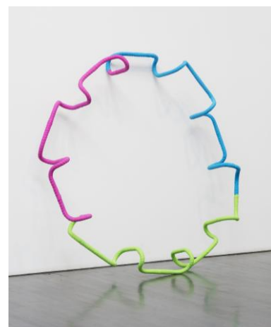
* 9 鬼頭健吾《orion》