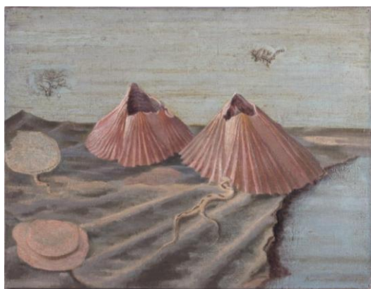
* 7 北脇昇《貝殻景観》