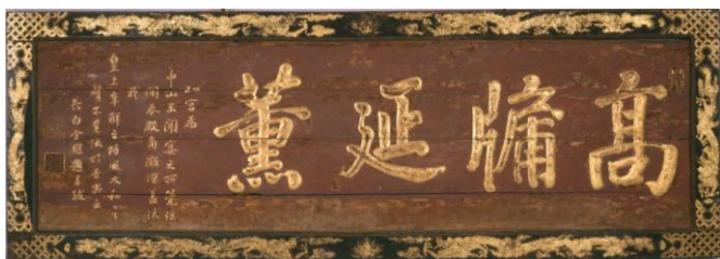
* 1 首里城北殿扁額《高牖延薰》