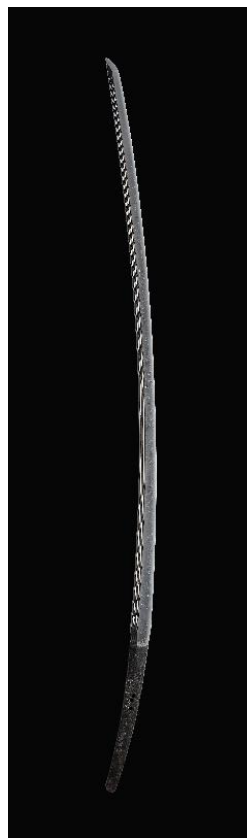
* 6 《太刀 銘 有綱