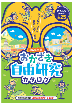
◀ 小学校に配布するパンフレット

「花火」「木材」「お米」「ドローン」「岡崎城」など、地元ならではのリアルな体験型研究を提供