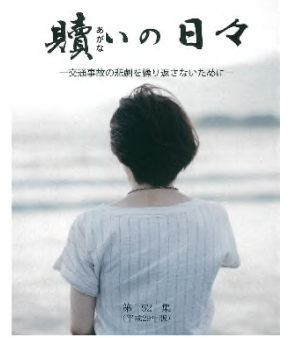
出版：贖いの日々 第52集 一般財団法人 東京都交通安全協会