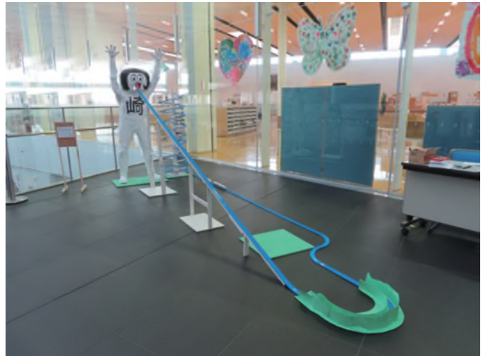
▲オカザえもんの芸術祭2020「オカザえもんの制作作品」展示風景