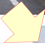
工事後: 平日ピーク時間帯14時台の状況