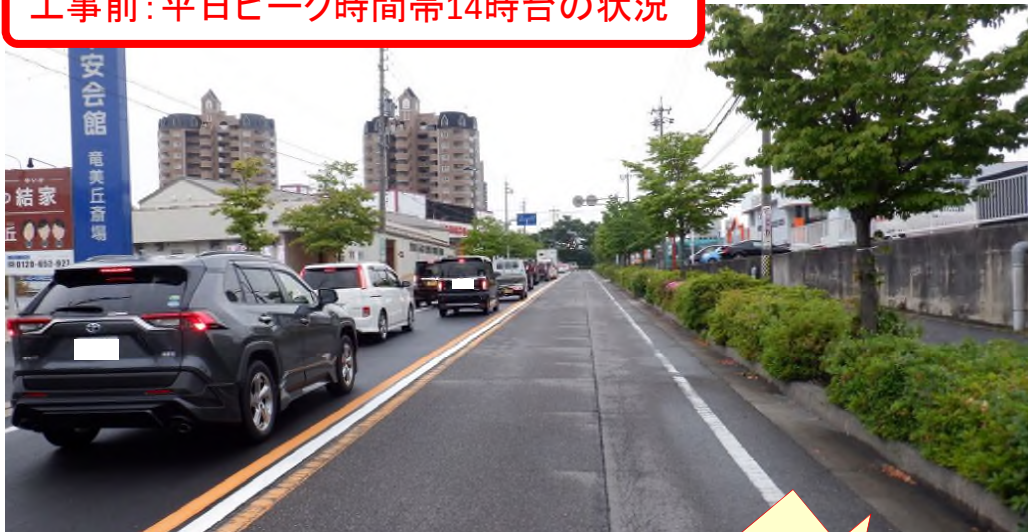
工事前: 平日ピーク時間帯14時台の状況