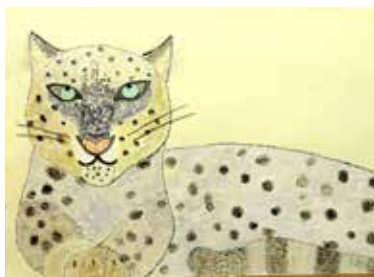
さむさにつよいゆきひょう