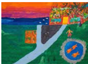
物語にできそうな昭和の一軒家