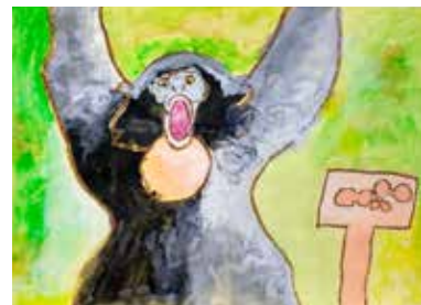
フロテナガザル～大きなえとむねのふくろにびっくり!!!