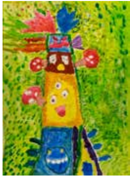
かさねた たっぶり山