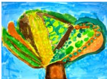
上にどんどんのびる木