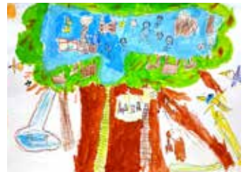
たのしいツリーハウス