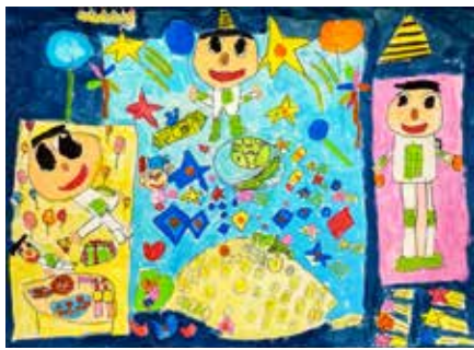
宇宙のパーティー