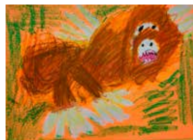
オランウータンはかわいいね