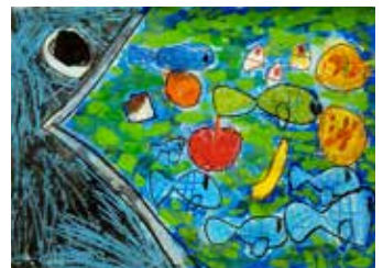
魚を食べるクジラ