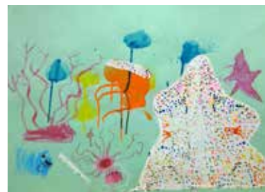
やどかりのものがたり