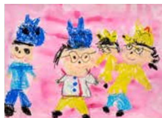
ぶんかさいでねこのおいしゃさんのやくをやったよ