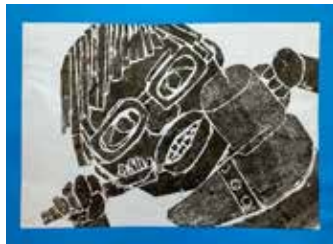
はみがきシユシユ