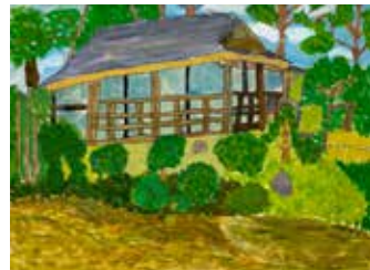
歴史を感じる奥殿陣屋