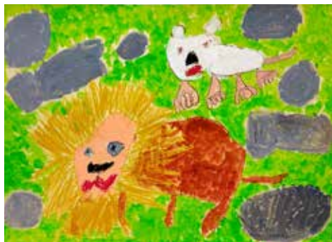
なかよしなライオン～ナイチンゲールのうたをよんで～