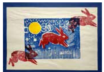
びよんびよんはねているうさぎ