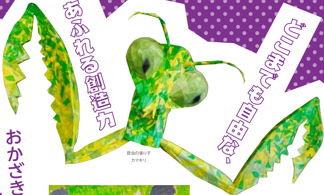
昆虫の張り子 カマキリ