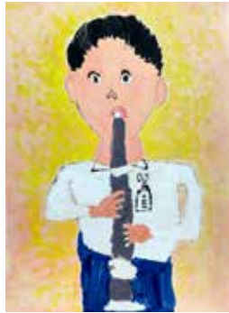
リコーダーをふいているぼく