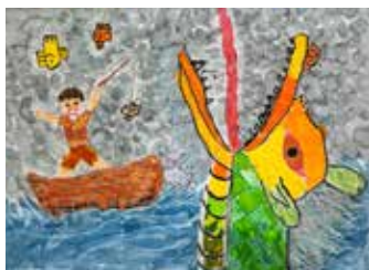
りゅうがびっくり