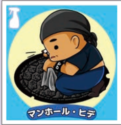
ひで@ポケふたメンテナンス部