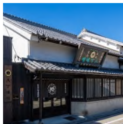
(株)まるや八丁味噌事務所棟