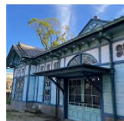
旧額田郡物産陳列所