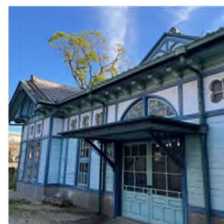
旧額田郡物産陳列所

江戸時代初期より豆味噌を造り続ける老舗のひとつ「まるや」の事務所棟。旧東海道の町家の意匠を残す。第6号岡崎市景観重要建造物。2