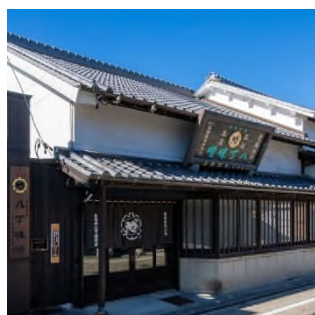
株式会社まるや八丁味噌事務所棟

岡崎城旧本丸に位置し、諸願成就や開運守護のお社として信仰される神社。祭神は徳川家康公、本多忠勝朝臣、天神地祇、護国英霊。