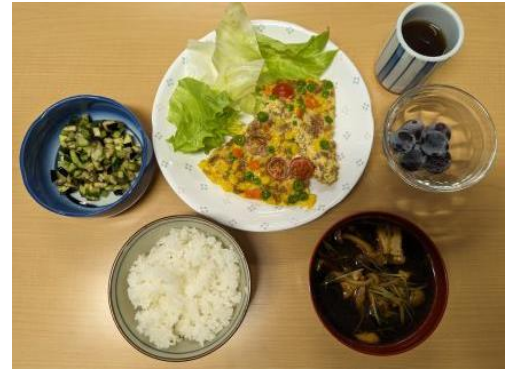
調理実習で作った料理