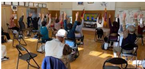
みんなで集まってごまんぞく体操