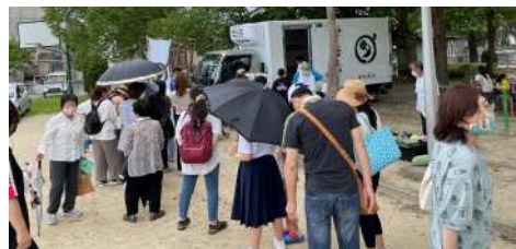
楽しいイベントに参加