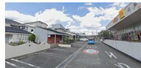
荷物が重くても平気