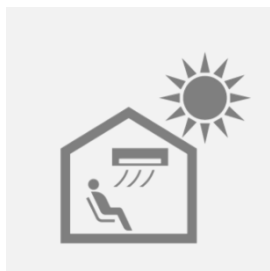
クーリングシェルター