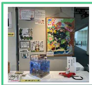
岡崎市長・一般障がい者の皆さん

岡崎市図書館交流プラザ りぶら 2階ギャラリースペース・お堀通り 「岡崎市康生通西4丁目71番地」