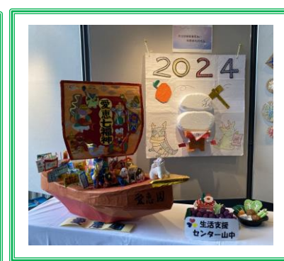
生活支援センター山中の皆さん