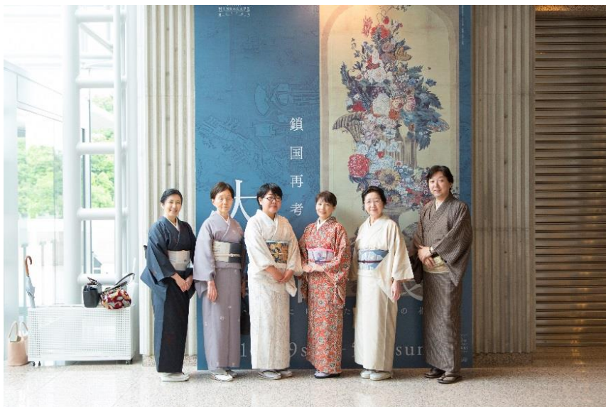
学芸員と巡る、着物 de 美博&絶景ランチ