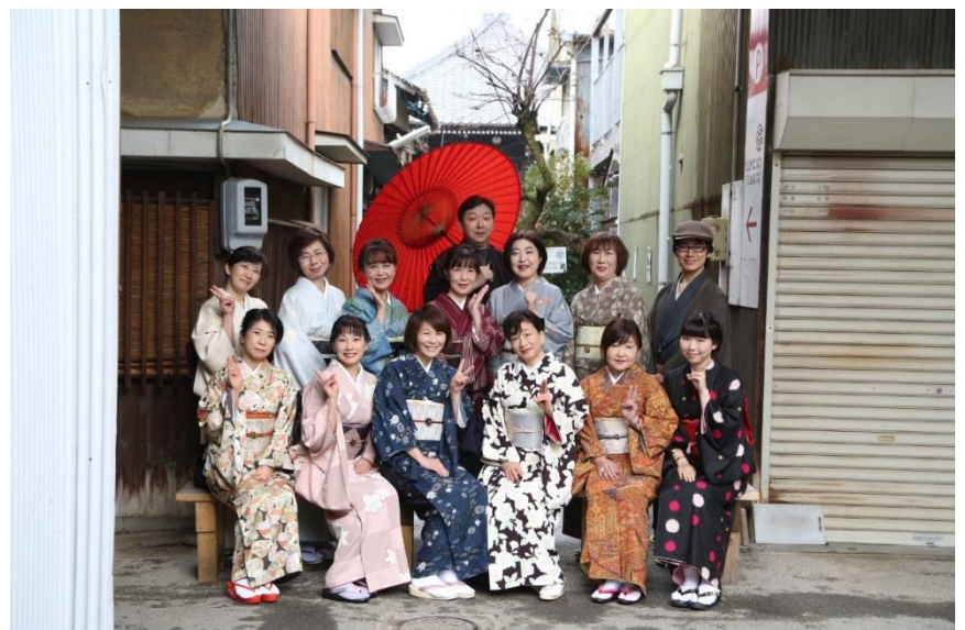
着物 de 街歩き@松應寺横町