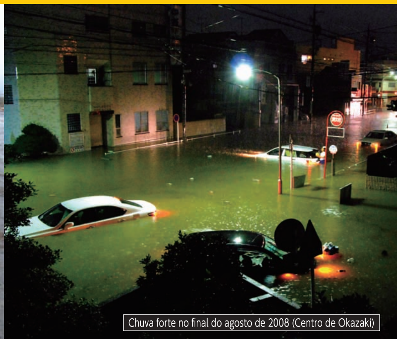
Chuva forte no final do agosto de 2008 (Centro de Okazaki)