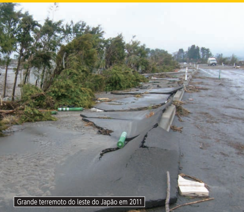
Grande terremoto do leste do Japão em 2011