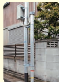
Indicador de Inundação

*Poderá verificar os locais de instalação através das "Explicações sobre o Serviço" no momento do cadastro.