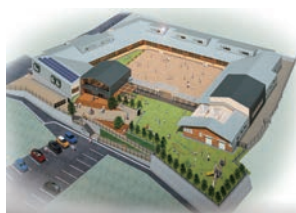
豊富保育園完成イメージ

答 豊富保育園への園児の送迎しており、これまでは送迎用駐車場から、いったん豊富小学校側の道路を経由して保育園へ登園していたが、今回の改築工事で保育園の敷地から出ることなく、送迎用駐車場から直接保育園に出入り出来るように階段とスロープを設置する。また、防犯対策については、外部から園庭への出入り口を職員室から目の届きやすい位置に配置するとともに、各保育室へもエントランスを経由して必ず職員室の前を通るように設計している。なお、人の出入りが予想される外部と園庭を中心に、5カ所に防犯カメラを設置する。