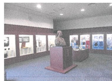
日本水泳の歴史資料室

個人的な見解ではあるが、岡崎市には競技水泳経験者が多く、昭和40年以降に生まれた世代は特に盛んに、個人差はあるが、学校やクラブで水泳競技を経験している。 現在、マラソン愛好家人口が増えているように、今後は健康促進のための水泳愛好家が増えていく下地が岡崎市には充分あると認識している。 手軽にできるスポーツとして、また個人の目標を立て記録に挑戦し、目に見える目的を持つスポーツとして、水泳は存在していると考え。 そうした岡崎市のスポーツに対する背景を考慮に入れて今後どのようなプールをつくるべか、市民の声を聞いていきたい。 市民大会や市民記録会など市民が気軽に参加できる大会が可能なプールを望み、現岡崎マラソンのように広く愛されるスポーツイベントを検討していきたい。 ケガの可能性の一番少ないスポーツと言われる水泳が「スポーツでまちづくり」の重要な役割を果たしていく。 早急に本市のプール建設計画について検討される事を強く要望する。